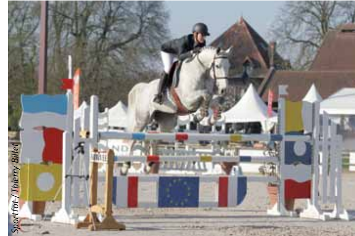
Sportfot / Thierry Billet